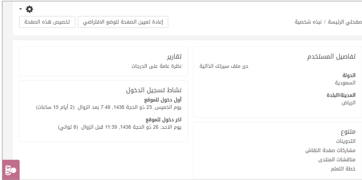
الشكل (3-1) تفاصيل الحساب الشخصي

تعرض هذه الصفحة بعض المعلومات عن المستخدم والتقارير وتسجيل الدخول وبعض المواضيع وسنشرحها بالتفصيل.