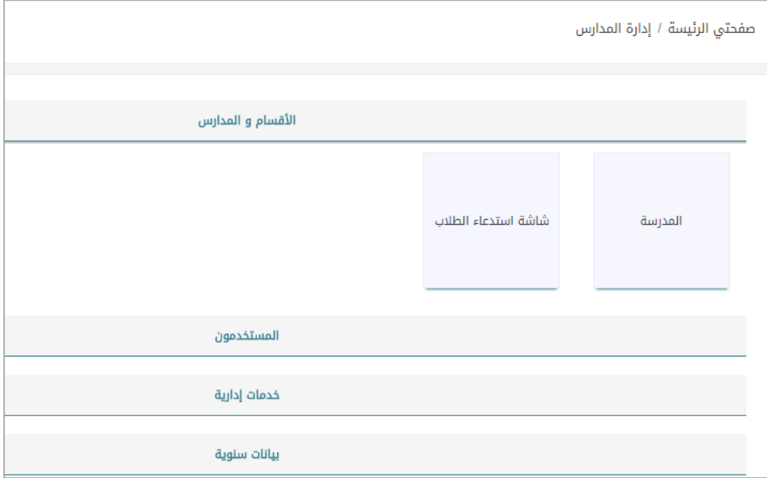
الشكل (1-1) أقسام الصفحة الرئيسية