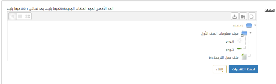
الشكل (11-1) مستعرض الملفات

من هنا يمكن لقائد المدرسة أن يضيف ملفاته الخاصة به والتي يتراوح حجمها بين 20 إلى 100 ميغا للملف الواحد.